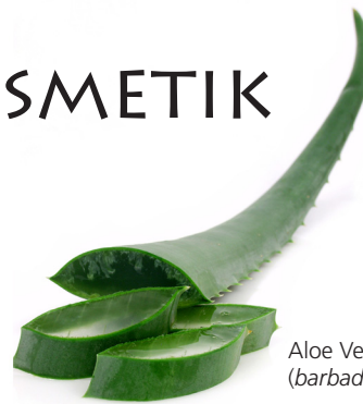
Aloe Vera ( barbadensis miller )